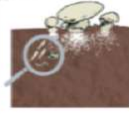
Bakterien, Pilze, Algen